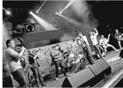
Brassclub, Liv, Suchtpotential